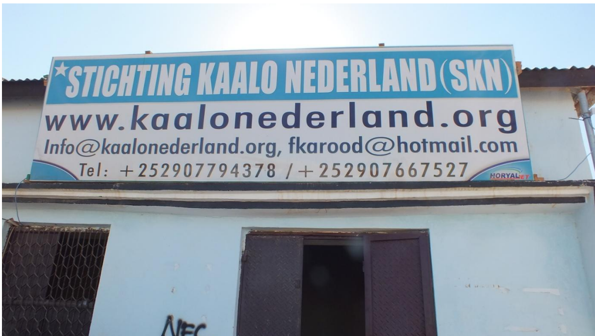
Kantoor van Kaalo Nederland in Garowe – Puntland – Somalië

Kaalo Nederland werkt ruim twintig jaar voor prachtige projecten in Puntland maar heeft voor zichzelf geen eigen inkomsten verworven. Toch zijn aan het werk kosten verbonden: accountact, reiskosten, overhead etc. De komende jaren zal hier meer aandacht voor zijn om zo de stichting voldoende basis te geven. Dit kan bijvoorbeeld door ook kleine projecten in Nederland uit te voeren ten behoeve van Somaliërs in Nederland én in Somalië.